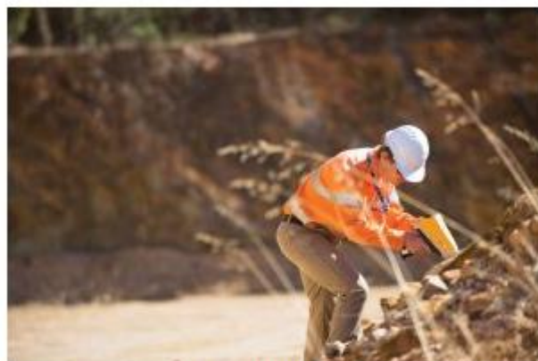
Vanta分析仪可为筛查应用和合规应用检测出各种危险物质。

由于 Vanta 分析仪在样件准备方面几乎没有什么要求，因此成为一款用于筛查大面积场地和分析袋装土壤、沉积物、岩芯、流体、尘扫物质、表面与过滤器等样品的理想工具。