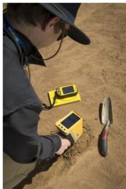
地理参考XRF数据可以有效跟踪检测结果，完成EPA方法6200的合规应用。